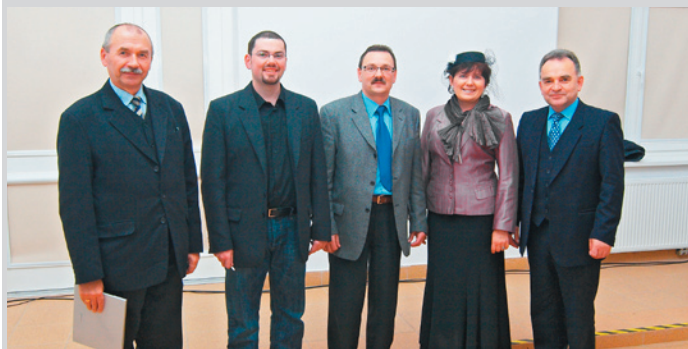
„Magiczne” miejsca w Domu Polsko – Słowackim

Późnym popołudniem 2 grudnia br. w Domu Polsko – Słowackim odbył się wernisaż otwierający wystawę fotograficzną Kamila Bańkowskiego pt. „Piękno wspólnej krainy - Południowa Małopolska i północna Słowacja w fotografii”. Zaproszeni goście mieli okazję przekonać się jak ciekawe, wręcz „magiczne” miejsca kryją się na pograniczu polsko – słowackim uwiecznione na zdjęciach przez młodego sądeckiego fotografa. Na gościach duże wrażenie zrobiła także wzbogacona piękną muzyką klasyczną prezentacja multimedialna obejmująca inne prace młodego artysty z okresu ostatnich dwóch lat.