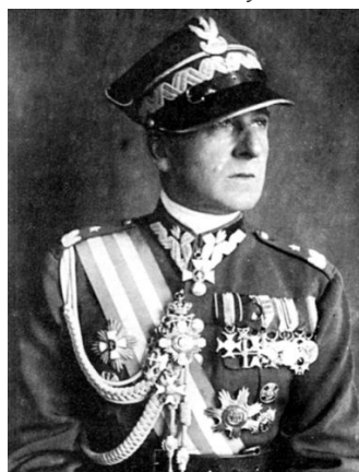
Bolesław Wieniawa Długoszowski