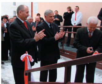
Trzeci Dom Polsko-Słowacki oddany