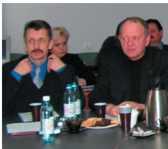
Wicemarszałek w Gorlicach