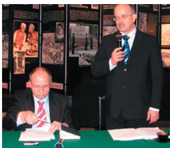
Wiceminister w Dworze Karwacjanów

MIEJSKI BIULETYN INFORMACYJNY NR 2/2008 (171) ISSN 14250829