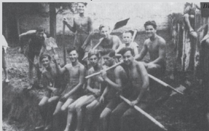
Uczniowie gorlickiego gimnazjum przy kopaniu szczelin przeciwlotniczych sierpień 1939

którzy pozostali wierni słowom „Polsko, kochaliśmy Cię więcej od życia”.