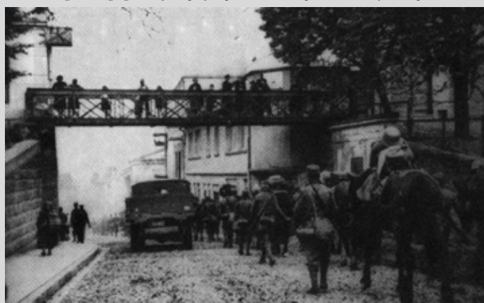
7 września 1939 - Przemarsz niemieckich żołnierzy przez Gorlice ( ul. Mickiewicza)